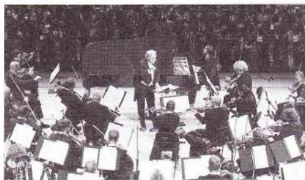
イザールフィルハーモニーのオープニング・コンサートから

黒地の木肌を生かした舞台に首席指揮者のヴァレリー・ゲルギエフが登場すると、まずはこのオープニングのためにティエリ・エスカイシュに委嘱した《Araising Dances》を披露。美しいヴァイオリンとヴィオラのソロにタンゴの要素が聴かれる、グルーブ感あふれる曲だ。続いてダニエル・トリフォノフをソリストに迎えたベートーヴェン「ピアノ協奏曲第1番」（最初の2日間は「第4番」）は、好奇心にあふれた若いころのモーツァルトそのもののような躍動感ある演奏を聴かせた。デュティユー《メタボール》を格好よく締めくくったあとは、シCHEDリン《封印された天使》の「第1曲」で、ミュンヘン・フィルハーモニー合唱団の透明な歌声が魂の清涼剤のように作用した。最後はラヴェル「《ダフニスとクロエ》第2組曲」で最高に盛り上がったオープニング・プログラムとなった。（中 東生）